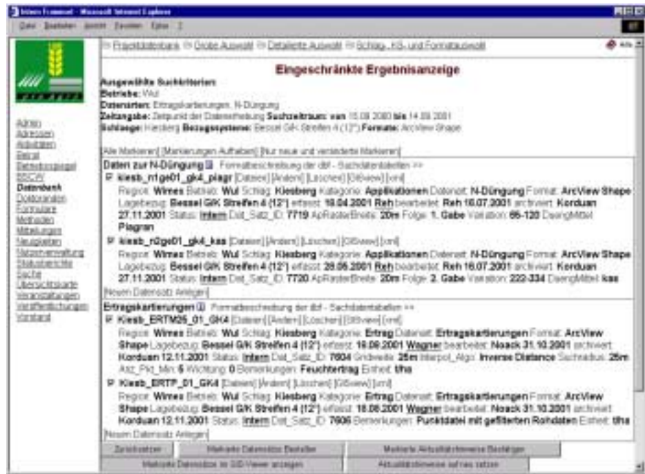
Abb. 4 Ergebnisanziege mit Metadaten und Funktionen

Der Anwendungsfall zur Bereitstellung dieser Daten für ein Jahr und einen Schlag setzt sich zusammen aus dem Anwendungsfall „In Daten recherchieren“ und „Daten beziehen“. Das Suchergebnis kann für jeden Benutzer separat abgespeichert werden (in Abbildung 3 unter „weitere Funktionen wählen“). Damit wird der Anwendungsfall zum Arbeitsschritt „Gespeichertes Suchergebnis abrufen“ zusammengefasst. In Abbildung 4 ist das Ergebnis einer Anfrage im premis in Listenform dargestellt.