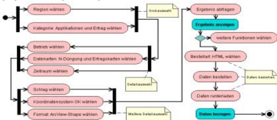
Abb. 3 Aktivitätsdiagramm zum Anwendungsfall Datenbereitstellung zur Stickstoffeffizienzberechnung

An Hand der genannten Anwendungsfälle lassen sich jetzt weitere praktische Anwendungsfälle spezifizieren, welche die Nutzung und Verwaltung von Daten im precision agriculture unterstützen. Ein solches Beispiel ist die Datenbereitstellung für die Ermittlung der Stickstoffeffizienz auf einem Schlag. Für diese Analyse werden die Applikationskarten zur N-Düngung und die Ertragskartierung verwendet.